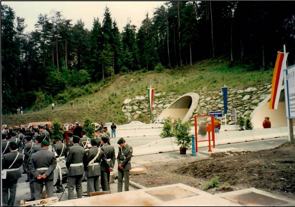
Cerimonia di inaugurazione delle gallerie autostradali a Klagenfurt.

Klagenfurt: giretto turistico per la città. Mercato tipico. Un'ottima pasticceria bar per un breakfast di mezza mattina.