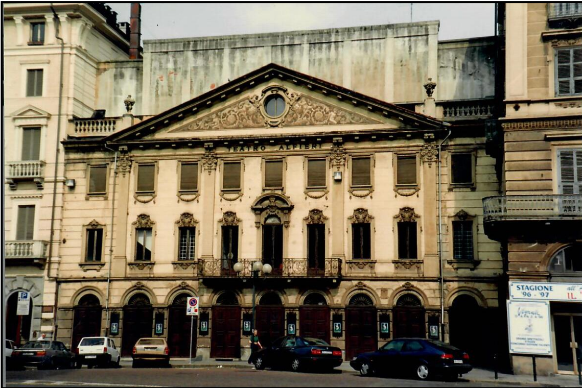
Teatro Alfieri di Torino