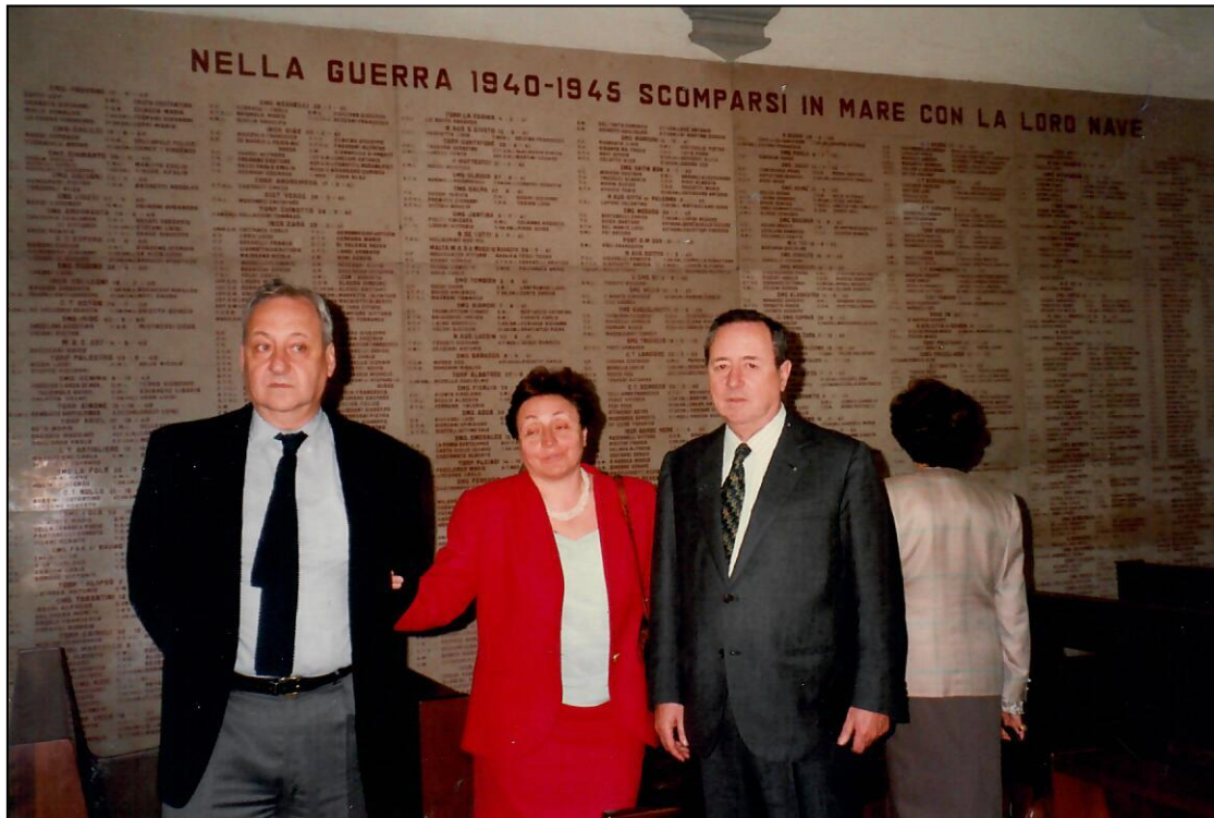
Viareggio Ristorante la Darsena