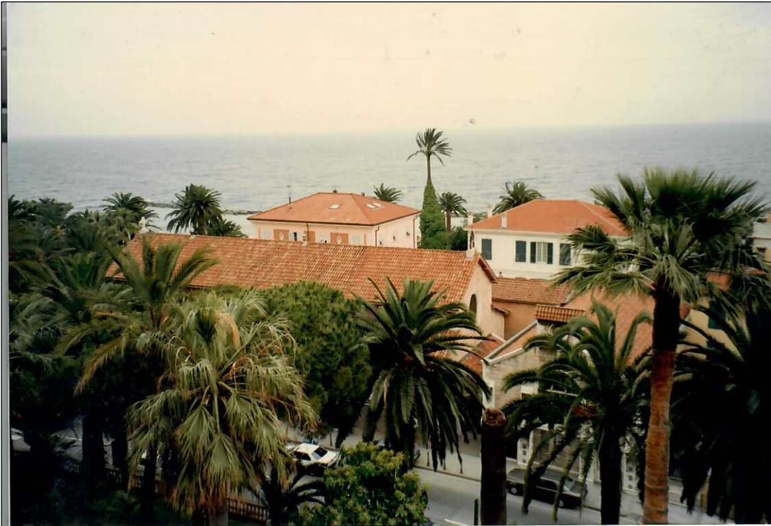
Sanremo dalla finestra dell'Hotel