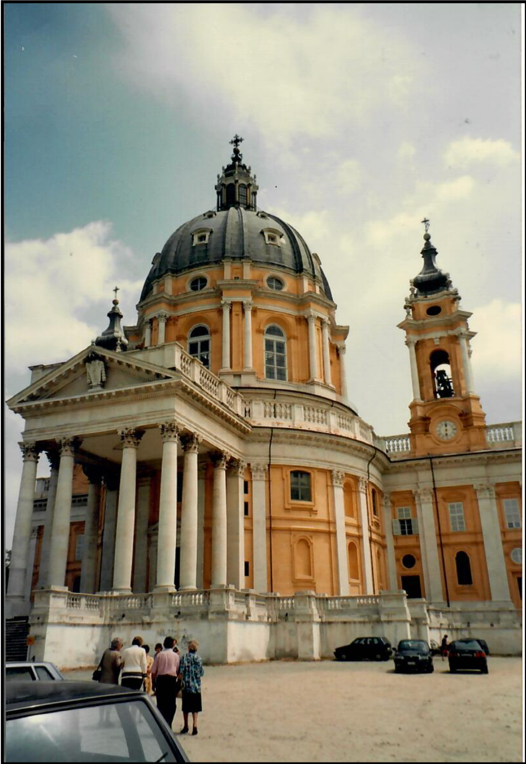
Basilica di Superga